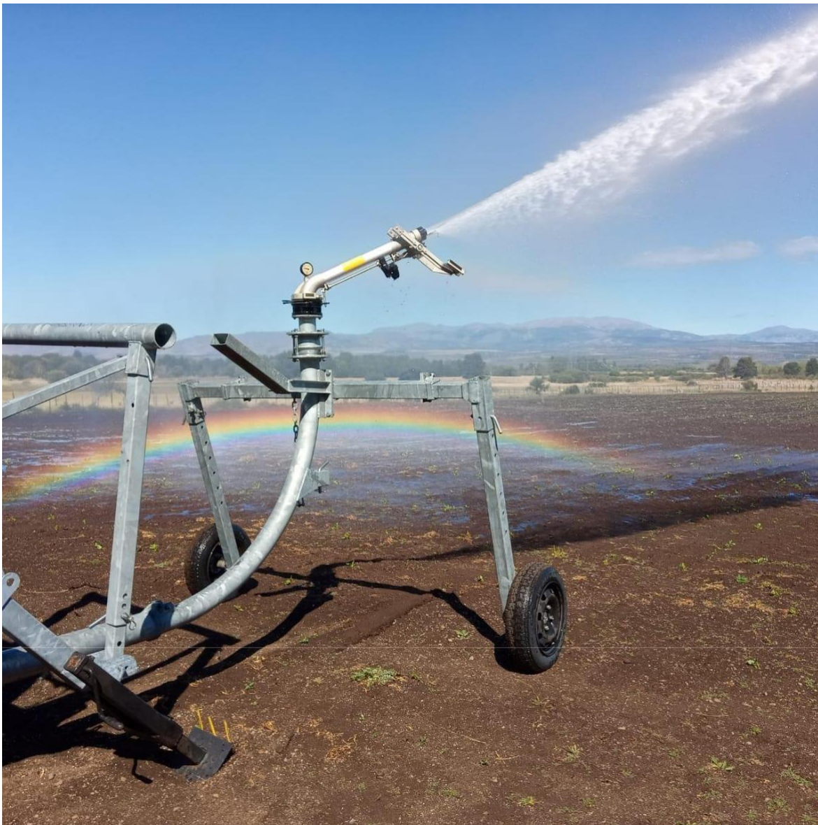
Riego con cañón en el Campo Experimental Agroforestal Trevelin - Cultivo de remolacha forrajera.

Finalmente, dentro del Campo Experimental Agroforestal Trevelin, y en el marco de la experimentación adaptativa del cultivo y uso de especies forrajeras alternativas, a partir de mediados de octubre de 2020 y durante la temporada, semanalmente se efectuó el riego con cañón y enrollador de 3 parcelas: 0,5 ha sembrada con una variedad de nabo de hoja (Hunter), 0,5 ha con una variedad de raps forrajera (Goliat) y 1 ha sembrada de remolacha forrajera (Beta vulgaris var. Gerónimo) para uso en pastoreo directo en invierno con ovinos.