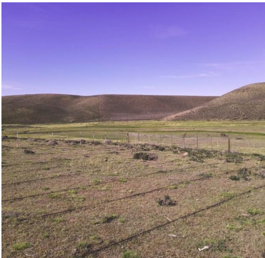
Riego por goteo por desnivel en paramelas, Tecka

En junio de 2020 se diseñó un sistema de riego por goteo por desnivel para regar un cultivo de paramelas ( Adesmia boronioides ) en la zona de Tecka. El mismo cuenta con un programador de riego a pilas que automatiza el riego, independizando al encargado de la operación manual del mismo. Se instaló en octubre y se han hecho visitas para corroborar el funcionamiento del mismo y su efecto sobre la implantación del cultivo.